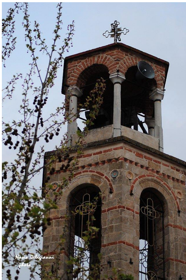
Εκκλησία στο Χρυσό