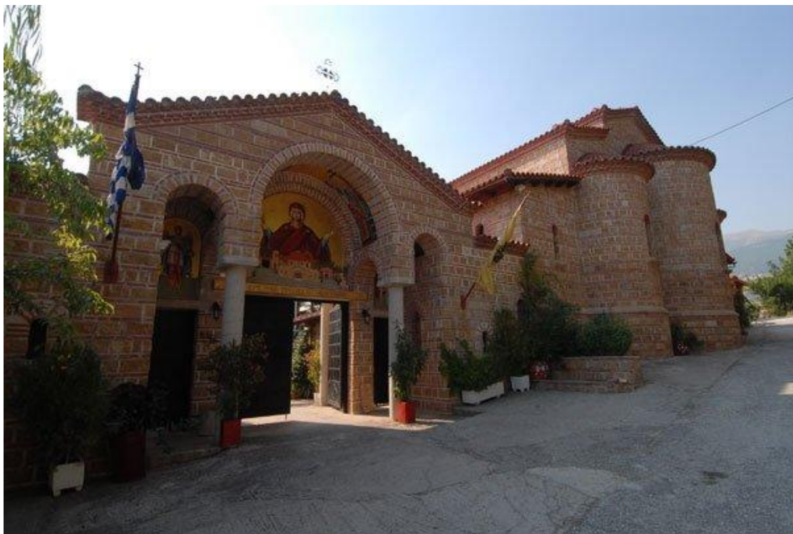
Ιερά Μονή Τιμίου Σταυρού στο Άγιο Πνεύμα