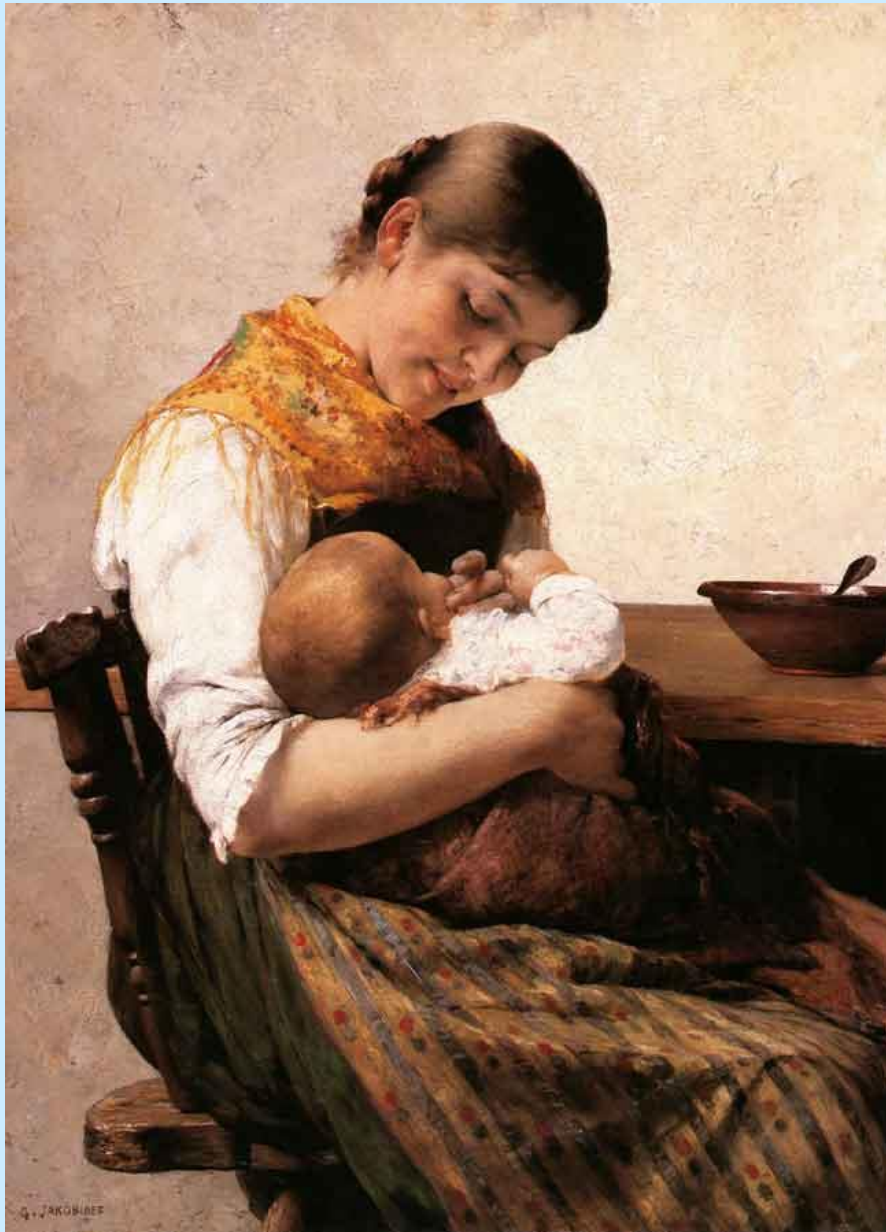
ΠΙΝΑΚΑΣ Γ. ΙΑΚΩΒΙΔΗΣ «Μητρική στοργή»